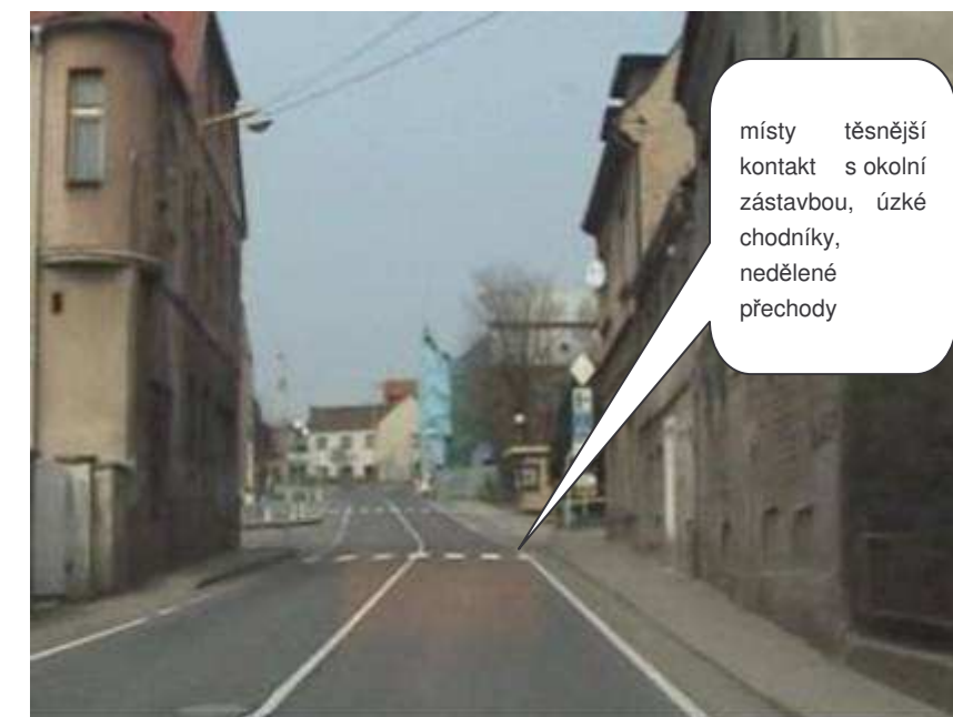
Žandov – II/262