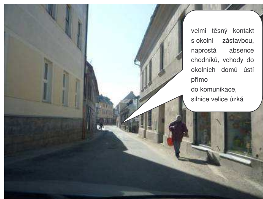
Vysoké nad Jizerou – II/290, ul. Dr. Karla Farského