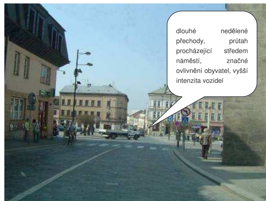
Turnov – II/283, Nám. Českého ráje