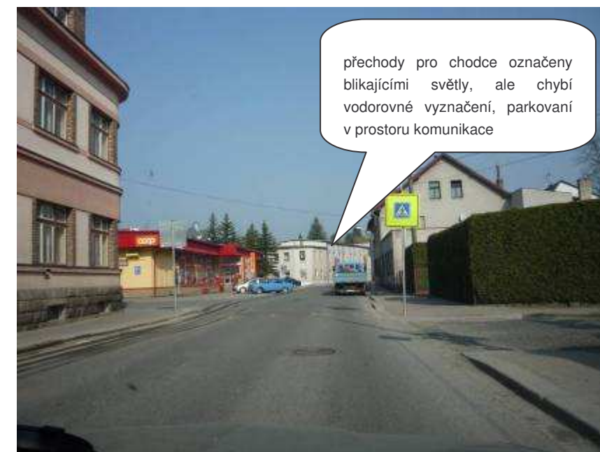
Lomnice nad Popelkou – II/284, ul. Palackého