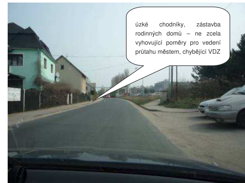
Česká Lípa – ul. Litoměřická