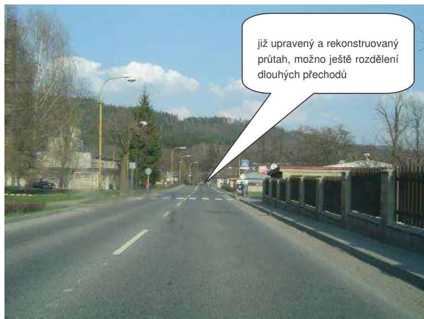
Hodkovice nad Mohelkou – II/278