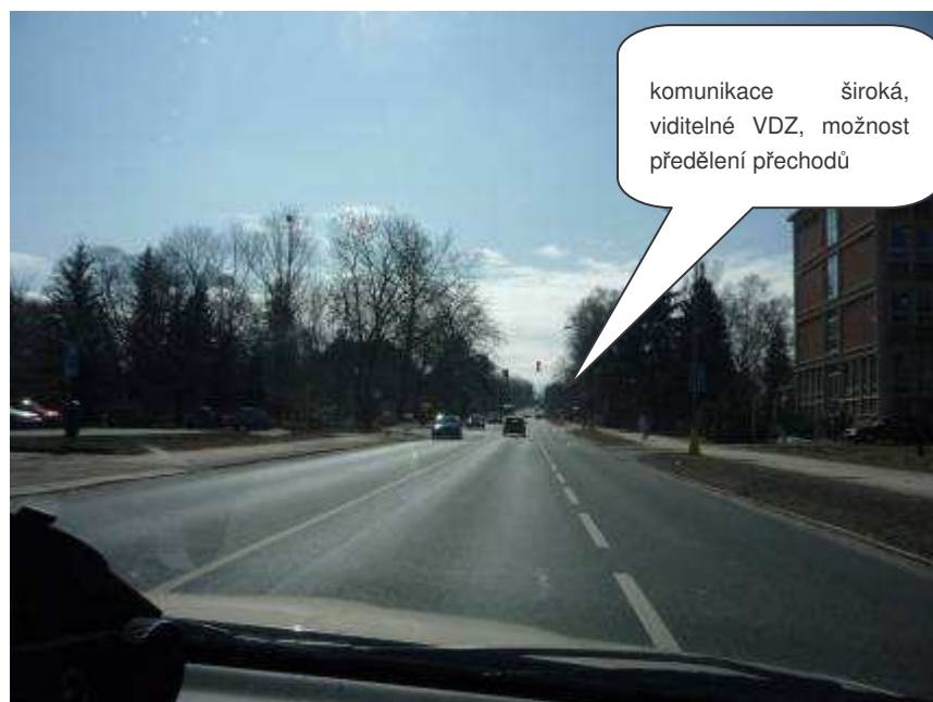
Jablonec nad Nisou – III/29029 – ul. Palackého