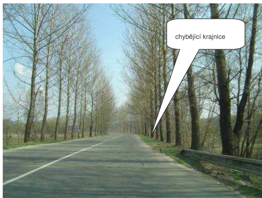
Stráž pod Ralskem – II/278