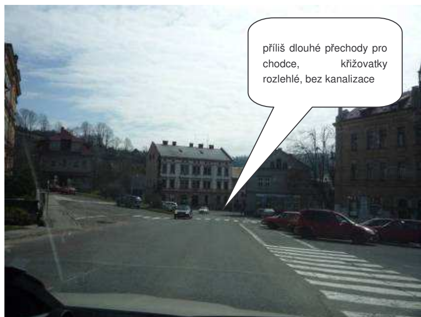
Semily – II/289, Komenského náměstí