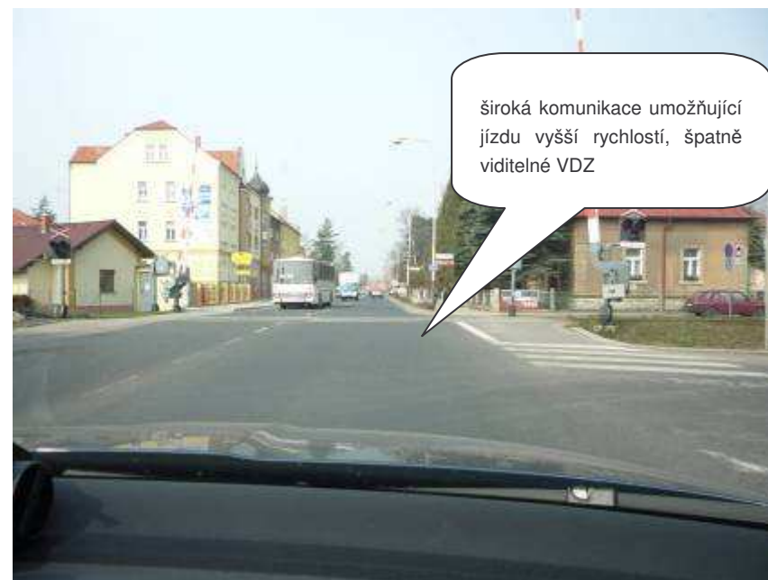
Česká Lípa – II/262