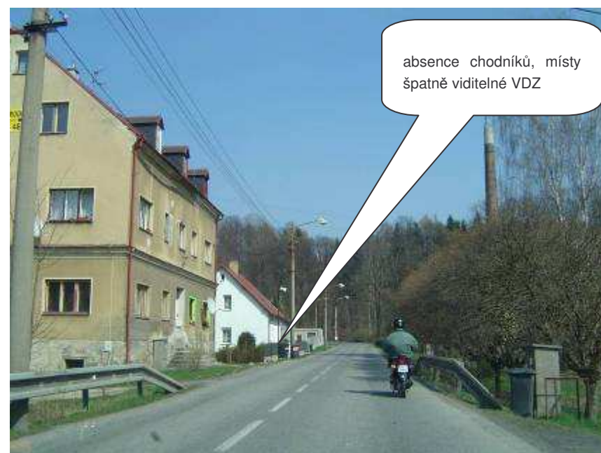
Chrastava – II/592, ul. Frýdlantská