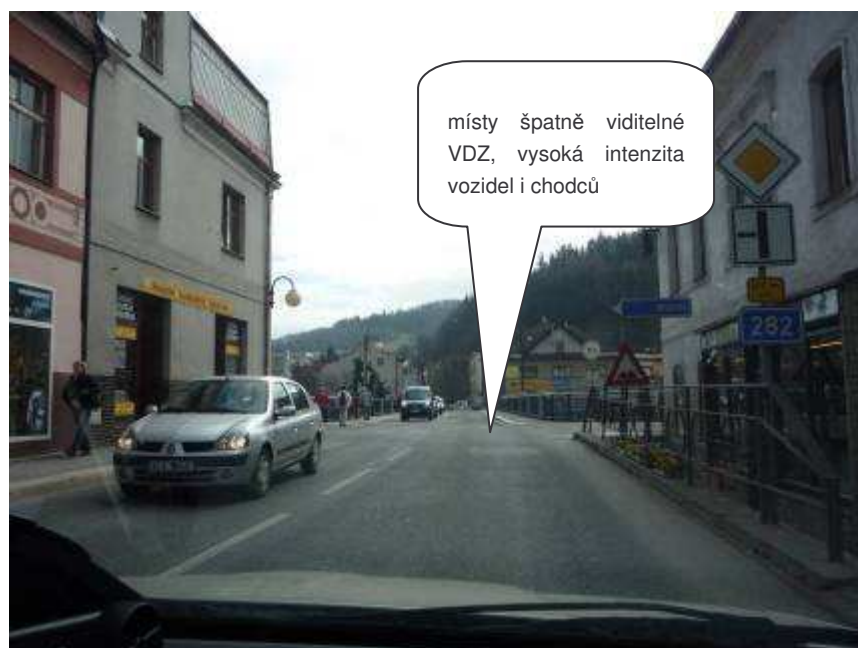
Železný Brod – II/282