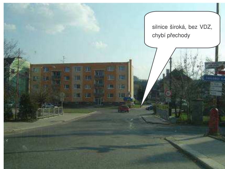
Rychnov u Jablonce nad Nisou – III/28711