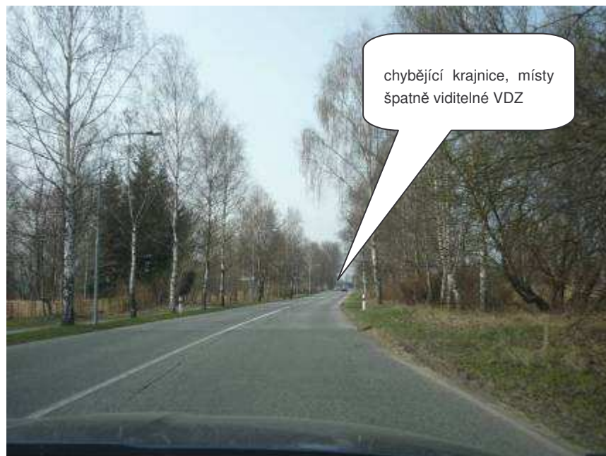
Ralsko – II/268