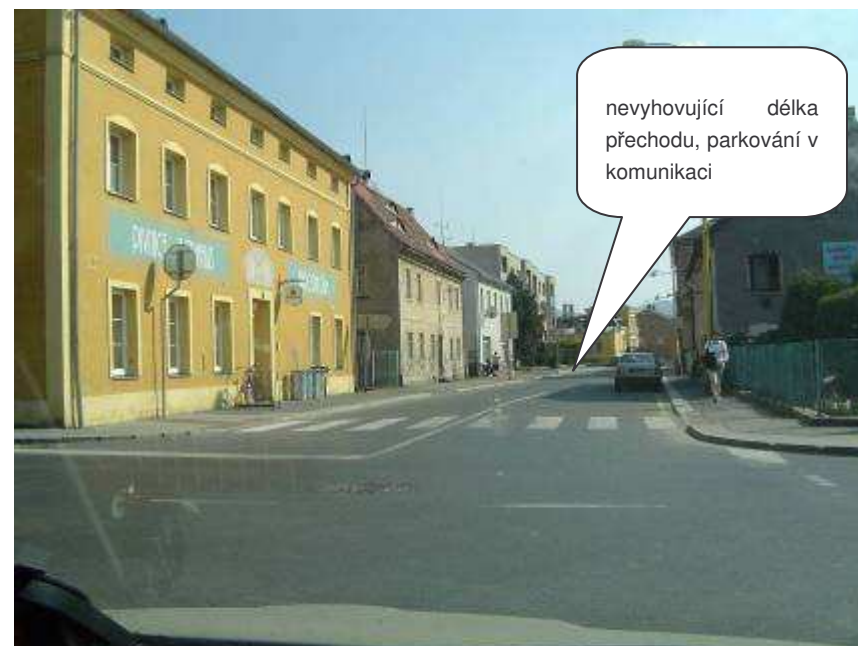
Hrádek nad Nisou – III/2716