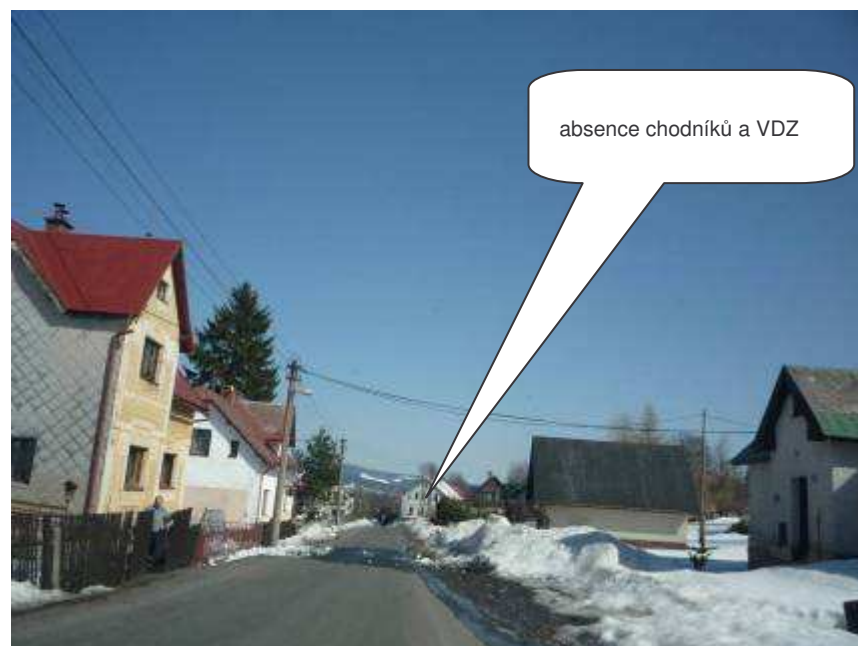
Lučany nad Nisou – III/29037