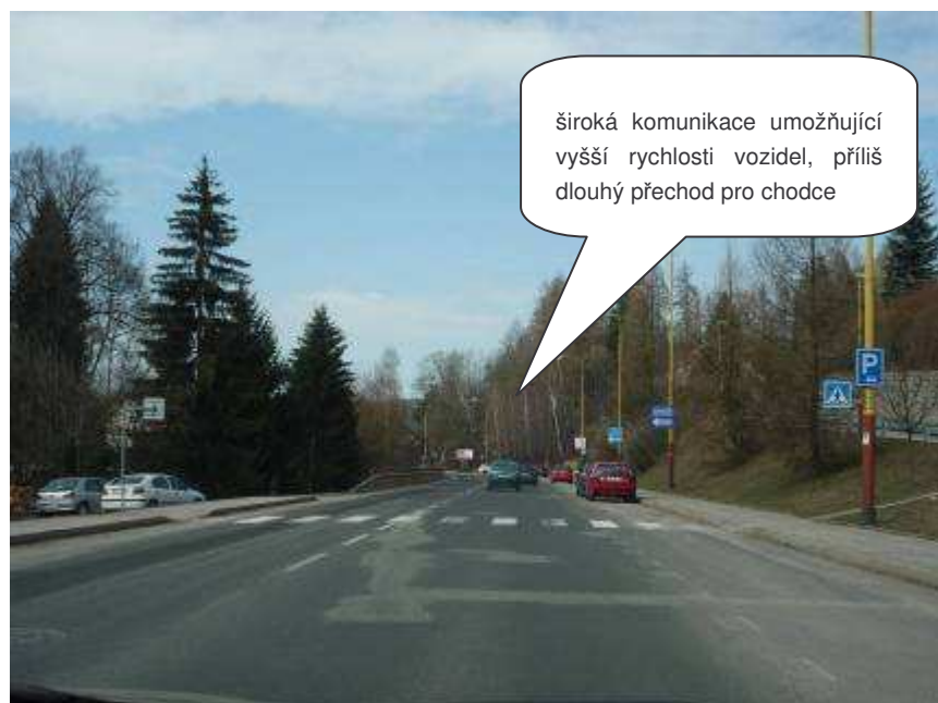
Jilemnice – II/286, ul. Krkonošská