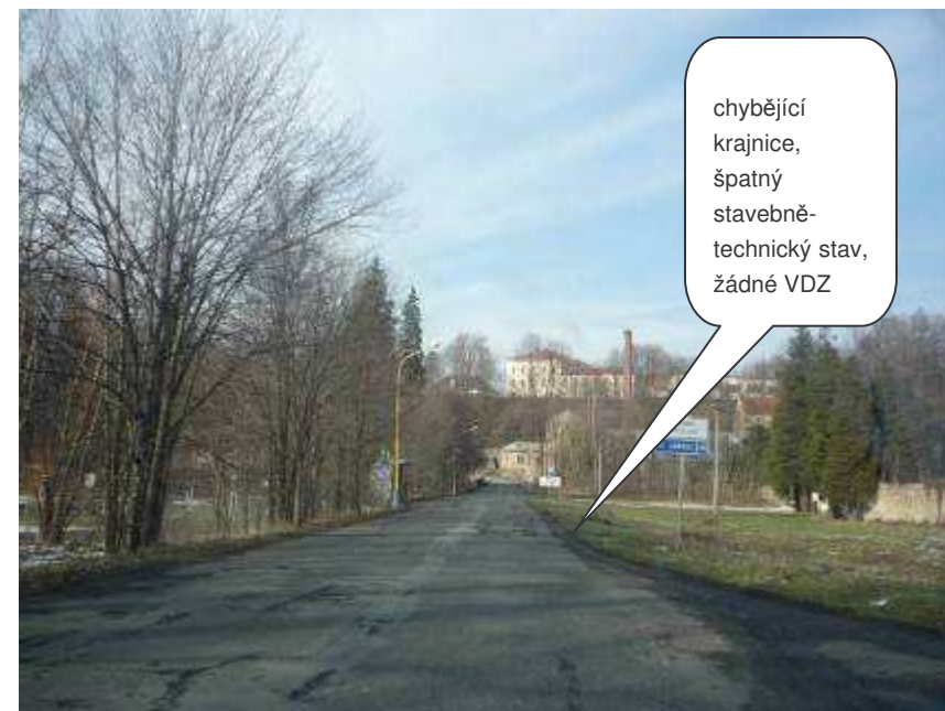
Frýdlant – II/290, ul. Hejnická

chybějící krajnice, špatný stavebně-technický stav, žádné VDZ