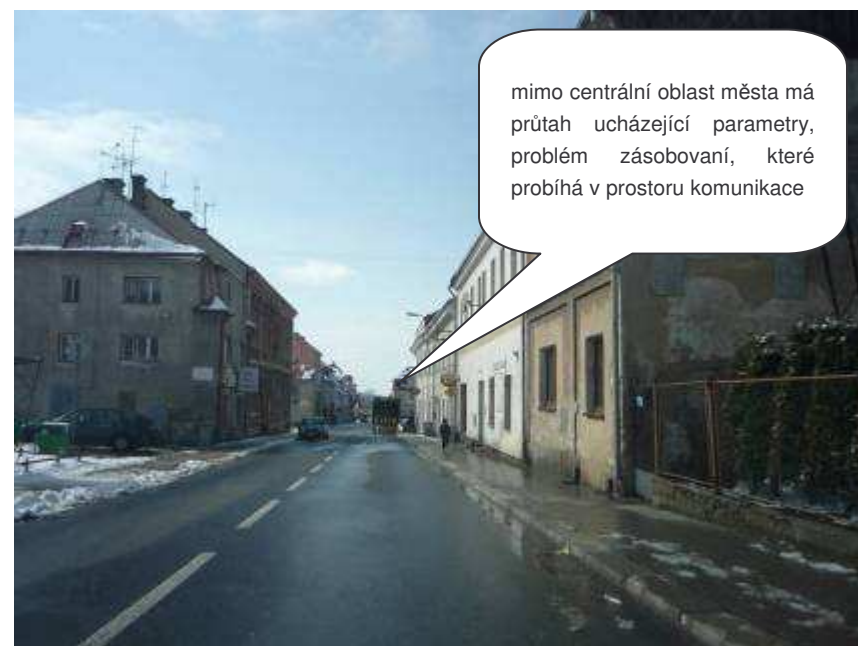
Nové Město pod Smrkem – II/291, ul. Frýdlantská

mimo centrální oblast města má průtah ucházející parametry, problém zásobování, které probíhá v prostoru komunikace