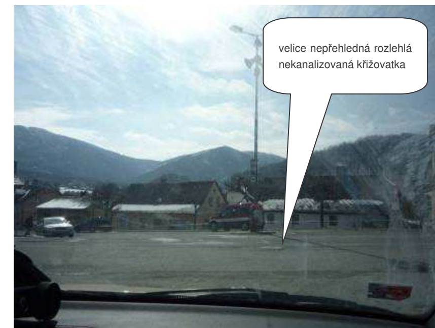
Hejnice – II/290 x III/29015