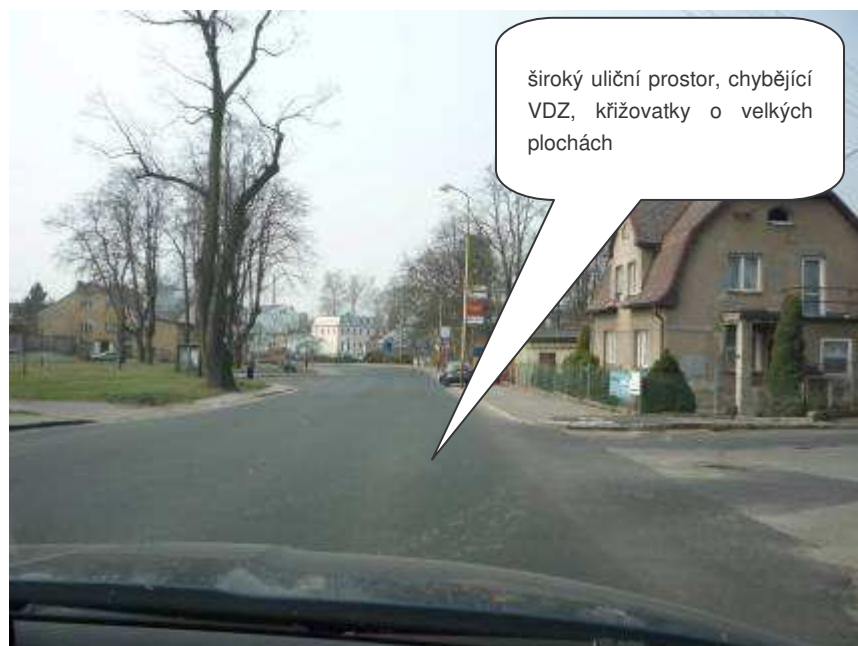
Nový Bor – II/268, ul. Liberecká

široký uliční prostor, chybějící VDZ, křižovatky o velkých plochách