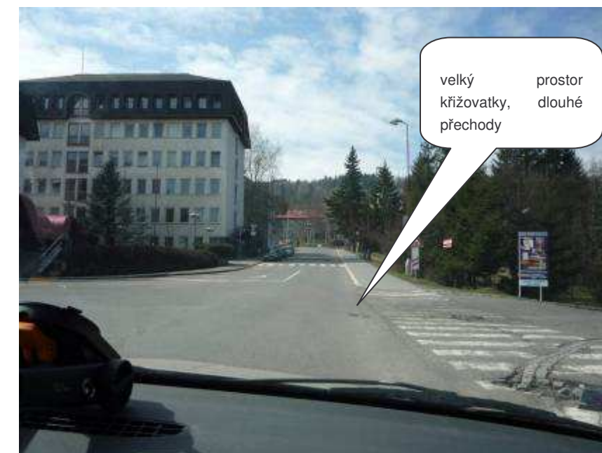
Semily – II/289, Nádražní x Bořkovská