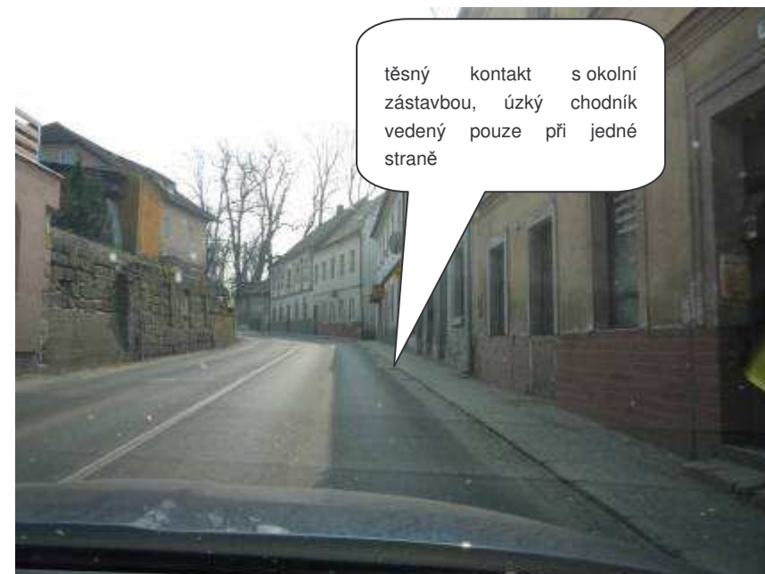
Doksy – II/270, ul. Máchova x ul. Komenského

těsný kontakt s okolní zástavbou, úzký chodník vedený pouze při jedné straně