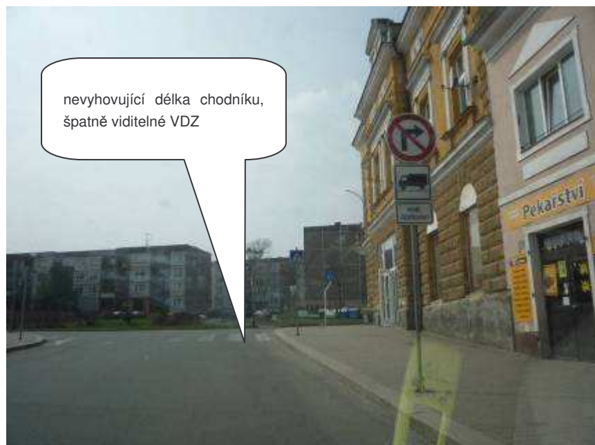
Cvikov – III/26481, Náměstí Osvobození