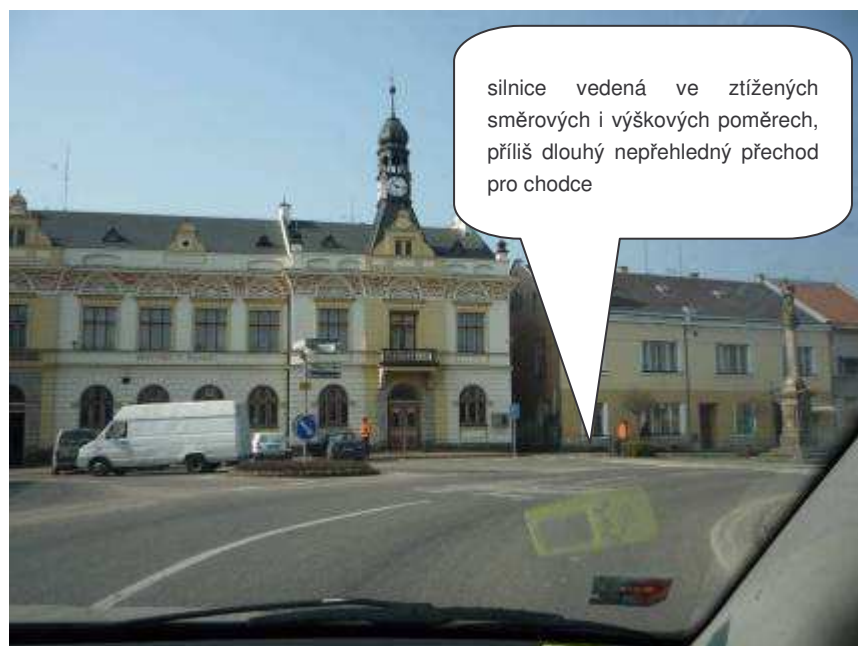
Rovensko pod Troskami – II/282