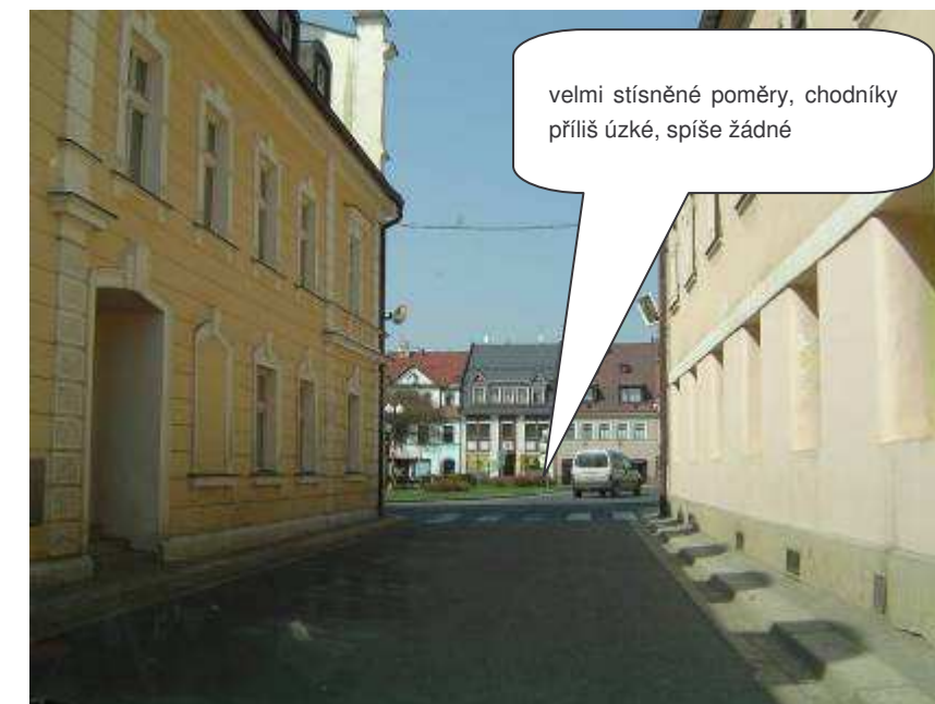
Chrastava – II/592, vjezd do náměstí