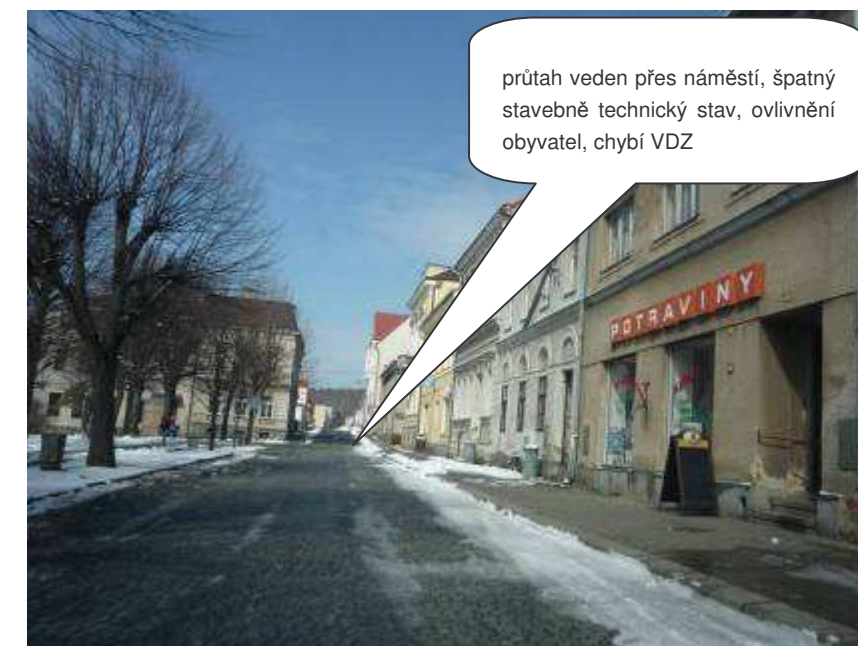
Nové Město pod Smrkem – II/291, ul. Jindřichovická

průtah veden přes náměstí, špatný stavebně technický stav, ovlivnění obyvatel, chybí VDZ