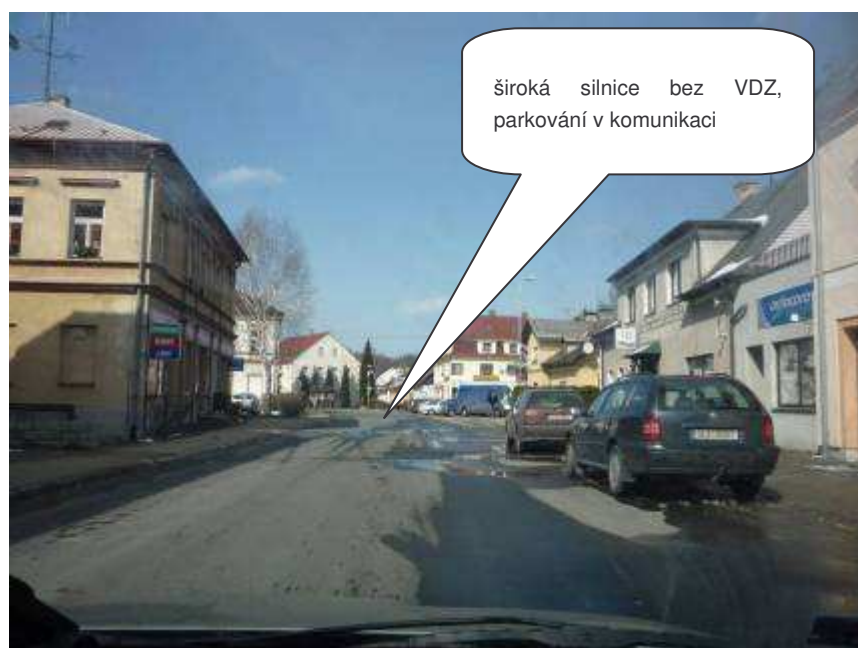
Hejnice – II/290, ul. Jizerská – souběh s ul. Klášterní