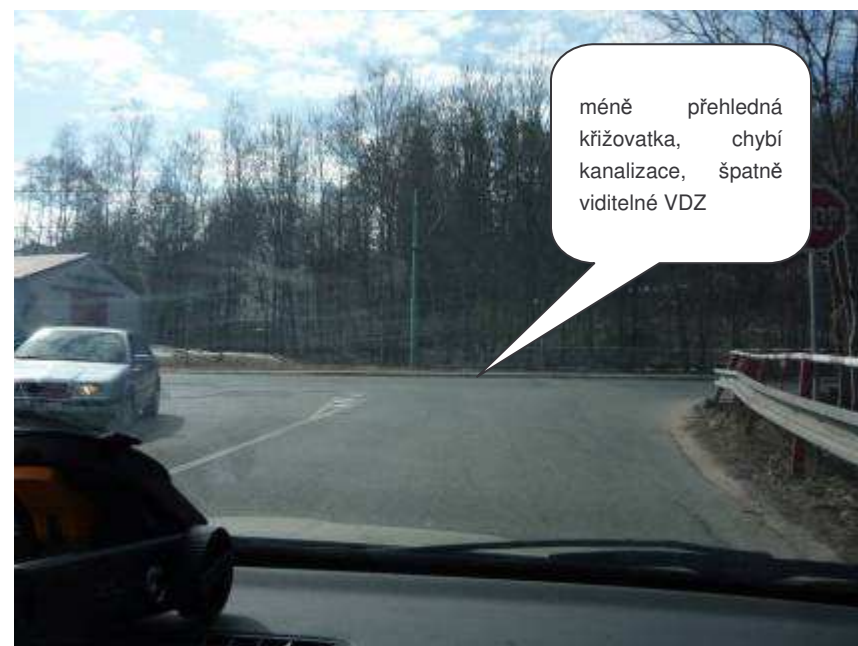
Jablonec nad Nisou – I/14 x III/29024