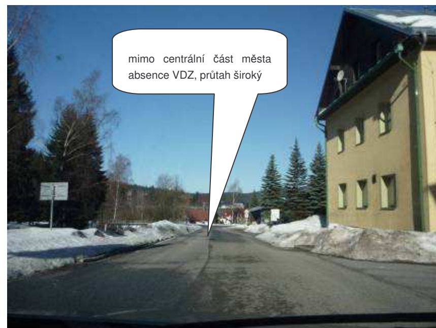
Harrachov – III/01021