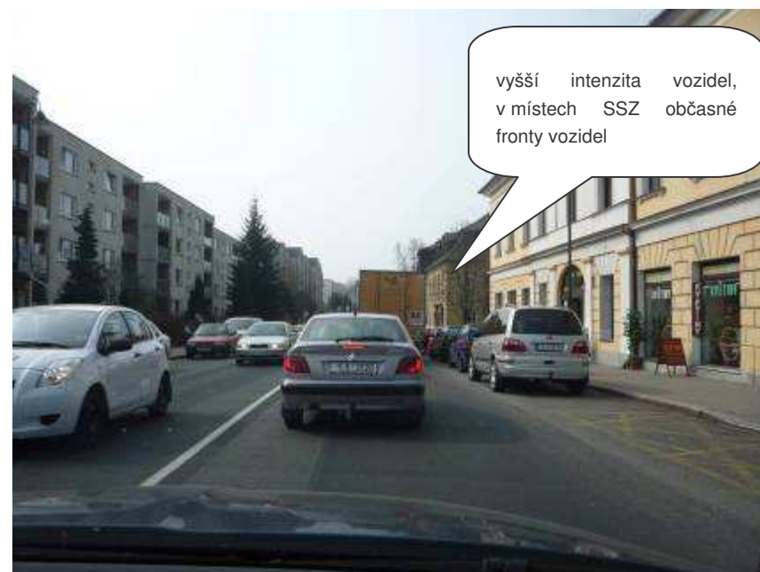
Nový Bor – Třída TGM

vyšší intenzita vozidel, v místech SSZ občasné fronty vozidel