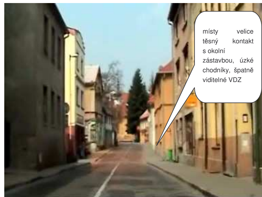
Zákupy – II/268