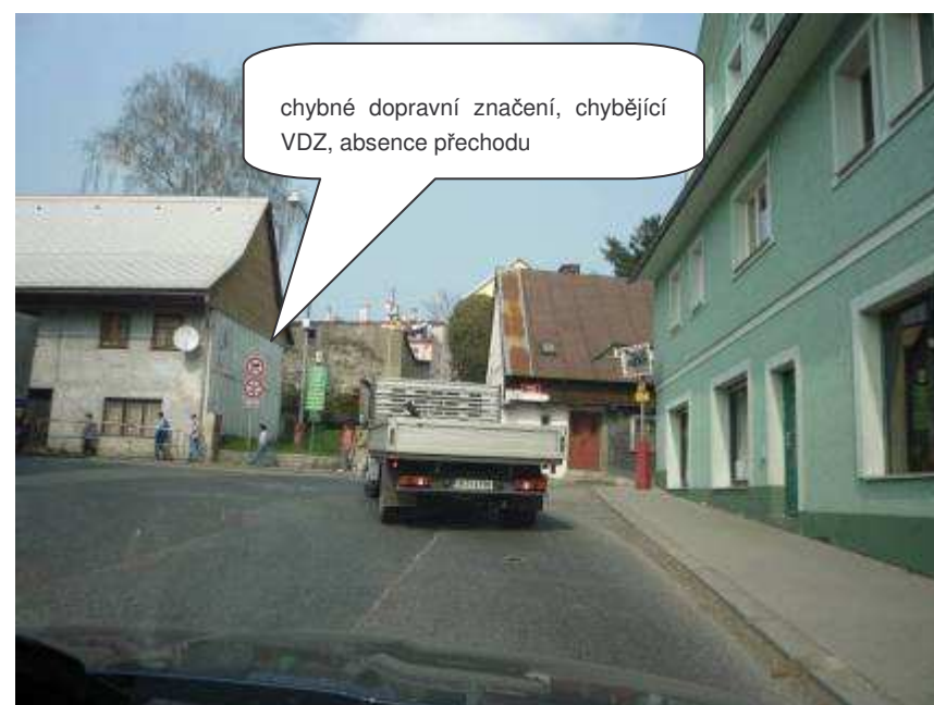
Jablonné v Podještědí – II/270, ul. Lidická