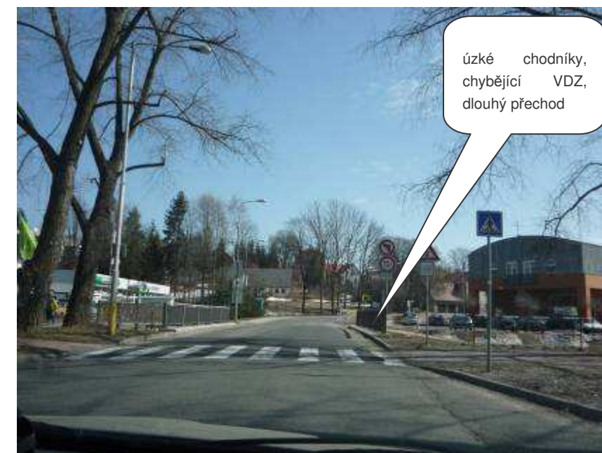
Jablonec nad Nisou – III/29024, ul. Želivského