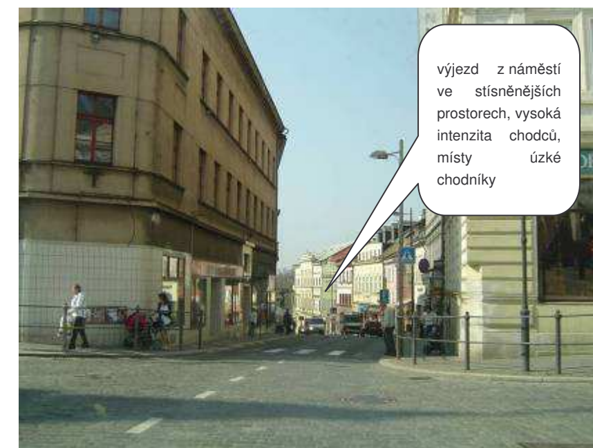
Turnov – II/283, ul. Hluboká