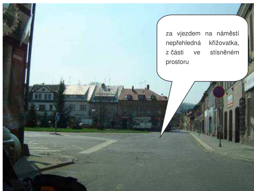
Chrastava – II/592, Frýdlantská x Spojovací x Nám. 1. máje