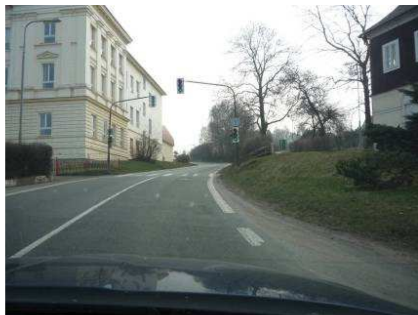
Kamenický Šenov – I/13