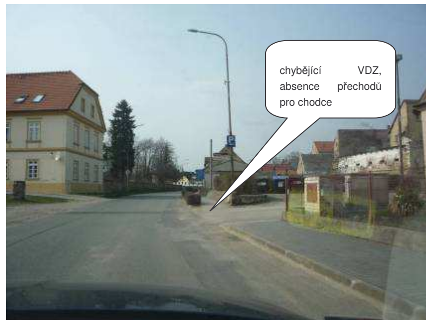
Dubá – II/259, ul. Požárníků

chybějící VDZ, absence přechodů pro chodce