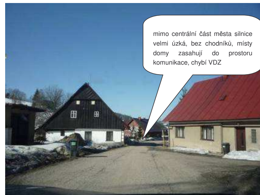
Rokytnice nad Jizerou – II/294