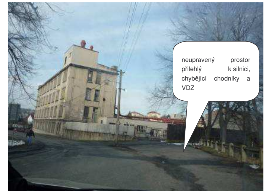
Frýdlant – II/290, ul. Hejnická

neupravený prostor přilehlý k silnici, chybějící chodníky a VDZ