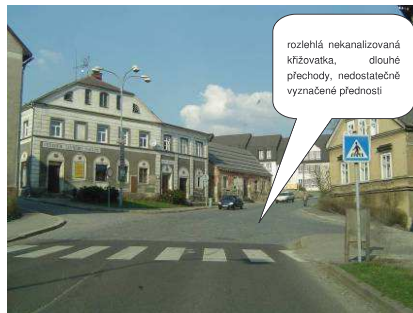
Český Dub – II/278 x II/277