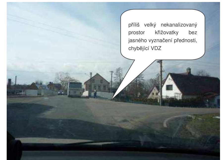
Raspenava – II/290