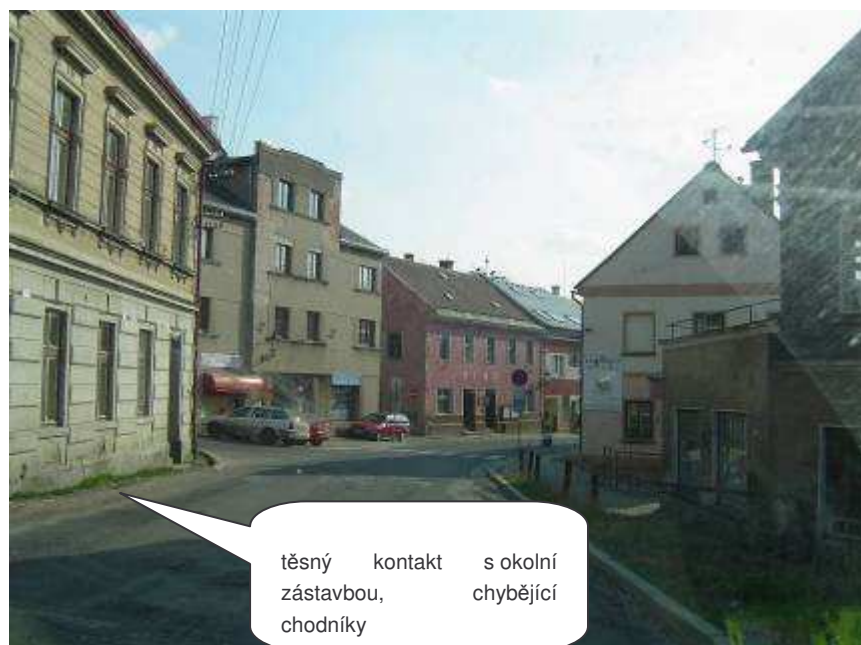
Český Dub – II/278, začátek zástavby