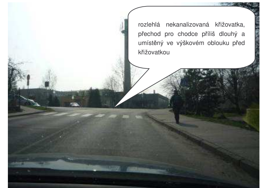
Doksy – II/270, ul. Valdštejnská

rozlehlá nekanalizovaná křižovatka, přechod pro chodce příliš dlouhý a umístěný ve výškovém oblouku před křižovatkou