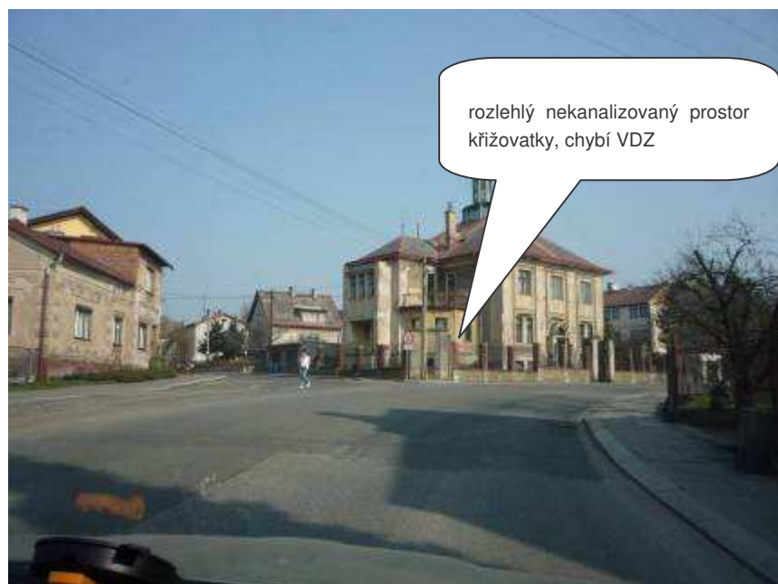
Lomnice nad Popelkou – II/284