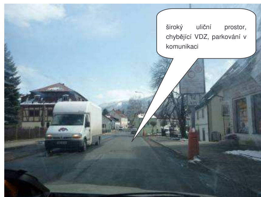
Hejnice – II/290, ul. Jizerská