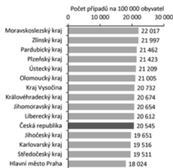
Graf 1: Hypertenze: demografické charakteristiky pacientů v ČR, 2010–2022.