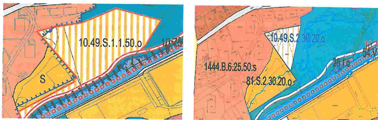
Obrázek 2: Původní a upravená dokumentace pro dohodu k bodu 2: plocha 10.49.S.1.1.50.o zredukována

K bodu 3: plochy 10.78.P, 11.147.P a 11.175.P