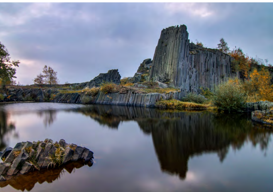
Panská skála, známá z pohádek, Foto: Petr Musil

tická atrakce. Turistům i místním slouží Šenovka dosud, od jara do podzimu po ní jezdí výletní vlak s názvem Kamenický motoráček .