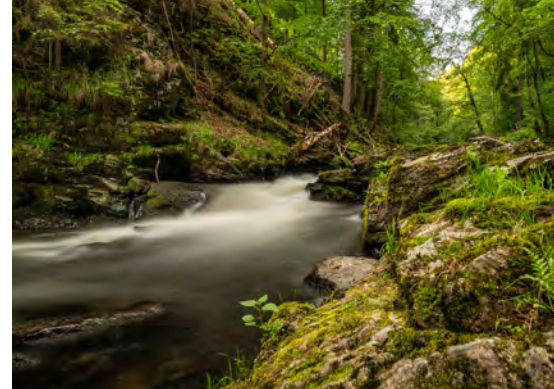
Řeka Kamenice, Foto: Pavla Bičíková

tu dobrotu v hotelové restauraci poblíž. Odtamtud už jenom seběhneme kopeček dolů k Lomnici nad Popelkou a na tamním nádraží už můžeme vyhlížet vlak zpátky do Boleslavi, Liberce nebo Nové Paky.