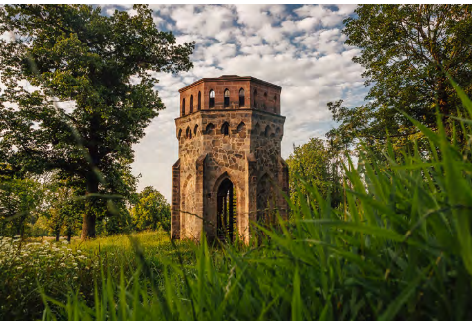
Allainova věž, nejromantičtější posed na světě