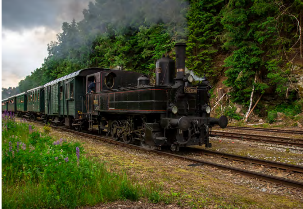
Parní vlak

Sklářské městečko v Lužických horách – Kamenický Šenov určitě známe díky Panské skále, nádhernému čedičovému skvostu, kde se točila nejedna pohádka. Historie tamní železnice určitě stojí za zmínku. V roce 1886 se trať Kamenický Šenov – Česká Kamenice slavnostně otevřela a v dalších letech se dráha dostavěla a cestující se tak bez přestupu mohli dostat až do České Lípy. Bohužel v roce 1979 se již trať netěšila velké oblibě a postupně byla na úseku Česká Lípa – Kamenický Šenov rozebrána. Všechno zlé je ale pro něco dobré a my si dnes na tomto úseku můžeme vychutnávat jízdu na kole, jelikož zde najdeme cyklostezku. Na trati Kamenický Šenov – Česká Kamenice se po roce 1997 rozjely historické vlaky a z lokálky se stala turis-