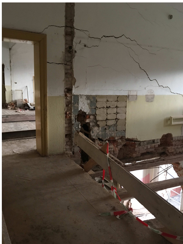
Stěna ve 3.n.p. „visí“ bez opory, navíc je oslabená komínovými průduchy