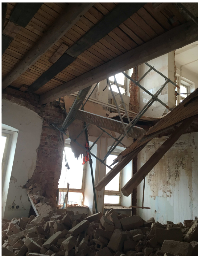
Pohled na havarovaný pilíř kolmý na fasádu – hladká styčná plocha bez vazby zdiva

Ve stěně nad havarovanou konstrukcí byl v minulosti též proveden dveřní otvor. Stěna tedy neměla pro havarijní účinek dostatečnou tuhost a zřítla se také. Teprve stěna ve 3.n.p., která není oslabená otvorem, v tuto chvíli „visí“ bez podpor pouze klenebným účinkem. Pád i této stěny se dá předpokládat v brzké době.