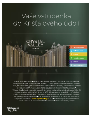
Vstupenka do Křišťálového údolí.