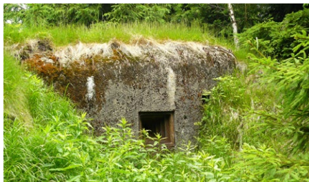
Bunkr lehkého opevnění na pomezí Jizerských hor a Krkonoš.

pod rozhlednou Štěpánka, si návštěvníci mohou prohlédnout v červenci a srpnu od úterka do neděle v čase 9–18 hodin. Více informací o muzeu na www.bunkrynapomezi.cz .