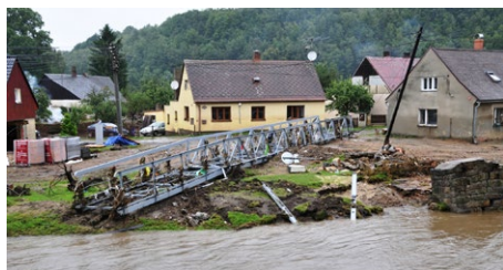
Zničený most přes řeku Nisu v Bílém Kostele po srpnové povodni v roce 2010.

V srpnu 2020 si připomeneme 10. výročí povodní, které zasáhly Liberecký kraj v roce 2010. Liberecký kraj ve spolupráci s obcí Bílý Kostel nad Nisou, Hasičským záchranným sborem LK a Sdružením hasičů – ČMS KSH LK pořádá v sobotu 8. srpna v Bílém Kostele nad Nisou vzpomínkovou akci. V rámci programu bude připomenut průběh povodně, její dopady do života obyvatel Libereckého kraje a budou předána vyznamenání za zásluhy v oblasti záchrany lidských životů. Připraven je také kulturní program.