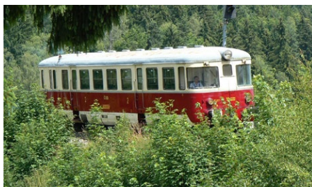
Motorový vůz M240.021, tzv. Singrovka, jezdí na ozubnicové trati při nostalgických jízdách.

O prázdninách chystá Železniční společnost Tanvald akce na jediné české ozubnicové trati z Tanvaldu do Kořenova a Harrachova. Těšit se můžete na nostalgické jízdy s unikátními ozubnicovými