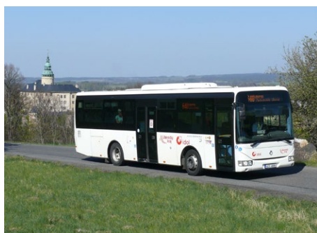
Turistické linky opět v provozu.

Koronavirus zasáhl i do veřejné dopravy, která vlivem nastavených opatření omezujících volný pohyb obyvatel pocítila výrazný úbytek cestujících. Zdálo se, že budou ohroženy i spoje, které slouží pro uspokojování volnočasových aktivit. „Turistické“ linky však z velké části přežily a s opožděným začátkem budou od června nebo o prázdninách v Libereckém kraji opět nabízet své služby. V autobusech i vlcích dopravci zajišťují dezinfikování prostor a po cestujících se žádá vzájemná ohleduplnost zejména v ochraně dýchacích cest a pokud možno dodržování bezpečné vzdálenosti. Rozsah nabídky turistických spojů doporučujeme ověřovat