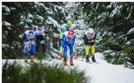
Jizerská padesátka se od roku 1971 (4. ročník závodu) běhá jako Memorál Expedice Peru 1970, kde zahynula celá výprava českých horolezců, spoluzakladatelů závodu. Cest jejich památce.

Letos se poběží již 53. ročník tradičního závodu běžeckého lyžování. Každoročně přijede do Jizerských hor změřit síly více než