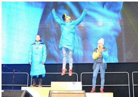
Z medailí na zimní olympiádě se nejčastěji radovala mládež z Libereckého kraje.

Celkem čtrnáct zlatých, patnáct stříbrných a deset bronzových medailí přivezli mladí sportovci z VIII. Her zimní olympiády dětí a mládeže ČR 2018, které se konaly v Pardubickém kraji. Liberecký kraj díky jejich skvělým výsledkům obsadil první místo mezi krajskými reprezentacemi, a to jak v bodovém hodnocení, tak co do počtu cenných kovů. Krajskou reprezentaci tvořilo dohromady 123 osob, z toho 94 sportovců a 29 trenérů. Mladí nadějní sportovci se utkali o medaile i bodová hodnocení v devíti zimních sportech – alpské lyžování, běžecké lyžování, biatlon, krasobruslení, lední hokej, lyžařský orientační běh, rychlobruslení, skicross, snowboarding a dvou doprovodných disciplínách – taneční soutěž a šachy. Mladí sportovci nasadili latku velmi vysoko, bude to pro ně velká výzva, protože Liberecký kraj převzal pomyslnou štafetu a bude pořadatelem letních olympijských her dětí a mládeže v roce 2019.