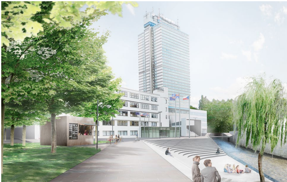
Vítězný návrh podoby dolního centra Liberce s přístupem k řece Nise od re:architekti studio s.r.o.

Liberecký kraj představil veřejnosti novou podobu dolního centra Liberce. Soutěž o architektonický návrh rekultivace a úpravy okolí budovy krajského úřadu v Liberci vypsal Liberecký kraj v letošním roce. Do soutěže se přihlásilo celkem deset architektonických návrhů, z nichž porota, složená z odborníků architektury a zástupců Libereckého kraje, vybrala dva. Autorem prvního návrhu je pražské re:architekti studio s.r.o., druhé místo patří liberecké společnosti SIAL architekti a inženýři spol. s r.o. Zadáním pro všechny návrhy bylo zpracování architektonicko-krajinářského návrhu úprav veřejného prostranství v okolí sídla Krajského úřadu Libereckého kraje. Hlavním požadavkem bylo začlenění budovy kraje, kultivace jejího okolí, které je výrazným, ale nedůstojným prostorem dolní části centra Liberce. Dalším požadavkem bylo zajištění přístupu k řece Nise lidem.