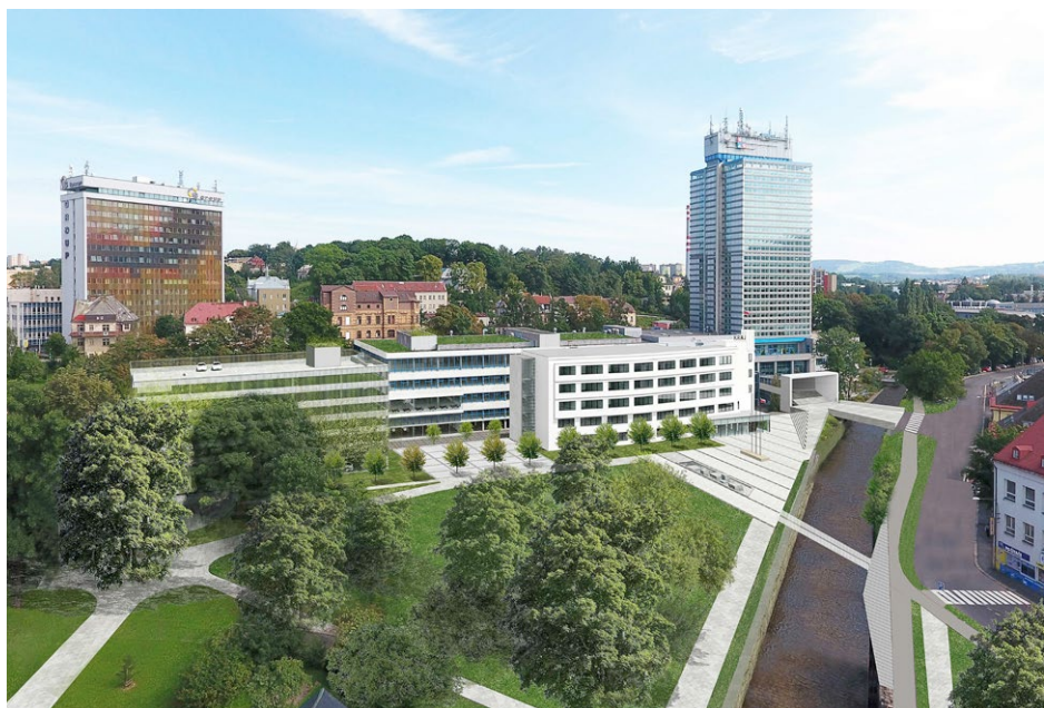
Návrh od SIAL architekti a inženýři spol. s r.o., který získal druhou cenu.