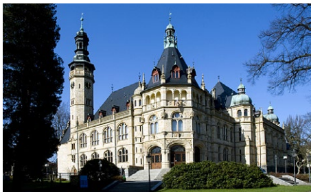
Severočeské muzeum v Liberci.

Takzvaná kulturní křižovatka mezi libereckou galerií a muzeem ožije v pátek 19. 5. tradiční akcí – Muzejní nocí pod Ještědem. Od šesti hodin až do půlnoci si návštěvníci mohou prohlédnout galerii či muzeum. Bohatý kulturní program se nebude odehrávat pouze uvnitř institucí,