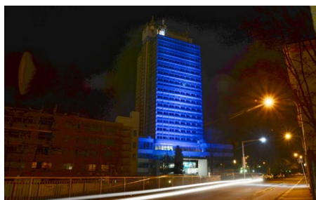
Sídlo Libereckého kraje v modrém nasvícení.

V noci z neděle 2. dubna na pondělí 3. dubna zářila budova Krajského úřadu Libereckého kraje modře. Nasvícením čelní stěny libereckého mrakodrapu a úvodní strany krajských internetových stránek se kraj již podruhé připojil k osvětové kampani „Česko svítí modře“. Jejím cílem je zvýšit povědomí společnosti o problematice autismu.