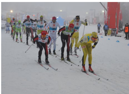
Jubilejní 50. ročník ČEZ Jizerské padesátky se pojede v novém termínu 17.–19. února 2017.

Účastníci Jizerské padesátky získají unikátní kalendář pro rok 2017, kde je na fotografiích zachycena minulost i současnost