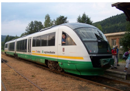
Spojení do Drážďan objednává Liberecký kraj a zajišťuje ho již třetím rokem společnost TRILEX.

Na zpáteční cestu je pak možné využít pravidelné spěšné vlaky s odjezdy z Drážďan v 13.08, 15.08 a 17.08 hod. a navíc ještě další vlak (jede pouze o adventních sobotách) v 16.28 hod. z Drážďan.