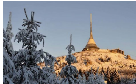
Liberecký kraj aktivně usiluje o zapsání národní kulturní památky Horský hotel a televizní vysílač Ještěd do seznamu památek UNESCO.

Zima, hory a sníh patří neodmyslitelně k sobě. Vzhledem ke svému hornatému rázu toto všechno Liberecký kraj nabízí a je tak ideálním místem pro zimní dovolenou. Zasněžené vrcholky našich hor snad nenechají v klidu žádnou romantickou duši.