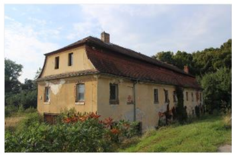
Bývalé kanceláře Obec: Jablonné v Podještědí