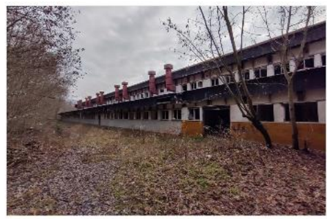
SCHD Františkov (středisko chov... Obec: Rokytnice nad Jizerou