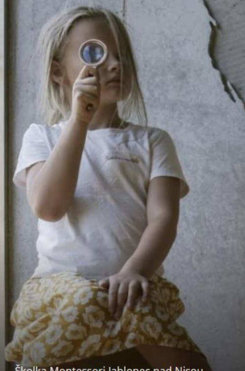
Školka Montessori Jablonec nad Nisou