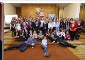
Parlament ZS v Parlamentu ČR