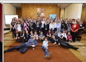
Parlament ZS v Parlamentu ČR